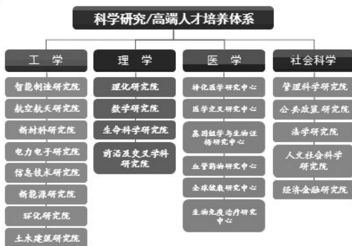
图1 科技创新港四大学科板块

是,面向国际科技前沿、面向国家重大需求、面向国民经济主战场,建立品行养成、知识传授、能力培养、思维创新“四位一体”的育人模式与支撑体系,致力于培养学生具备扎实的基础知识和深入系统的专业知识,具备运用所学知识解决实际问题的方法和能力,具备不断进取的创新意识和思维,具备强烈的责任感、事业心和担当精神;以培养学生的“工程领导力”为核心(见图2);着力打造创意创新创业教育生态系统,致力于培养具有人文情怀、科学素养、