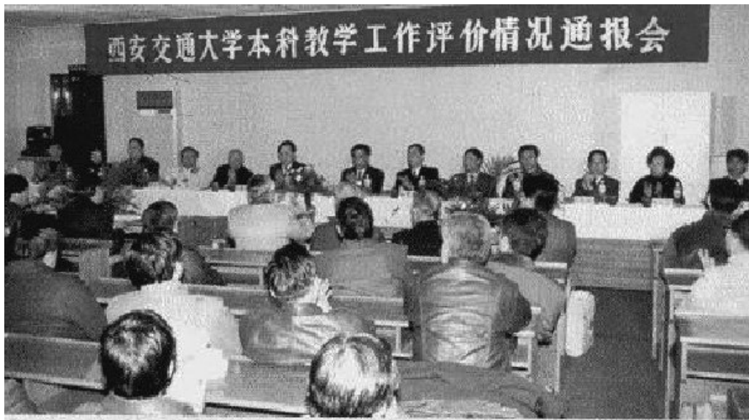
1995年12月8日,国家教委专家组本科教学工作评价情况通报会

教师言传身教的帮助下,承担了较重的教学任务,在教学第一线,在教学改革、教书育人等方面发挥了较好的作用。